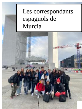
Les correspondants espagnols de Murcia